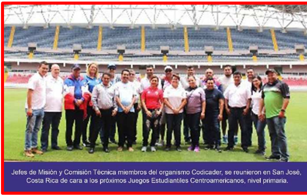
Jefes de Misión y Comisión Técnica miembros del organismo Codicader, se reunieron en San José, Costa Rica de cara a los próximos Juegos Estudiantiles Centroamericanos, nivel primaria.

Del 11 al 13 de septiembre en San José, Costa Rica Nicaragua estuvo representada por los