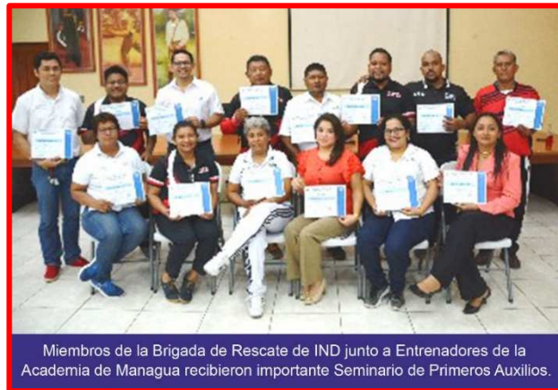
Miembros de la Brigada de Rescate de IND junto a Entrenadores de la Academia de Managua recibieron importante Seminario de Primeros Auxilios.

Cabe señalar que como parte de un Plan de Capacitación especial la Dirección de Formación y Capacitación junto a la Universidad del Valle e INATEC, llevaron a cabo el seminario de Primeros Auxilios, dirigido a entrenadores de la Academia de