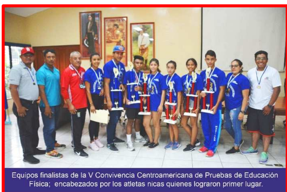
Equipos finalistas de la V Convivencia Centroamericana de Pruebas de Educación Física, encabezados por los atletas nicas quienes lograron primer lugar.