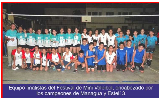
Equipo finalistas del Festival de Mini Voleibol, encabezado por los campeones de Managua y Estelí 3.

Los conjuntos de Managua y Estelí 3, ocuparon las plazas de honor en las ramas masculina y femenina, durante el Festival de Mini Voleibol celebrado el domingo 29 de septiembre en el gimnasio del Colegio Nuestra Señora del Rosario en la ciudad norteña, donde se dieron cita un total de 22 conjuntos, 11 en cada género.