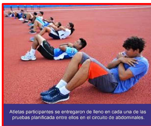
Atletas participantes se entregaron de lleno en cada una de las pruebas planificada entre ellos en el circuito de abdominales.

En los resultados colectivos, Nicaragua fue primero (141 puntos), seguido por Guatemala (132) y Honduras tercero (91).