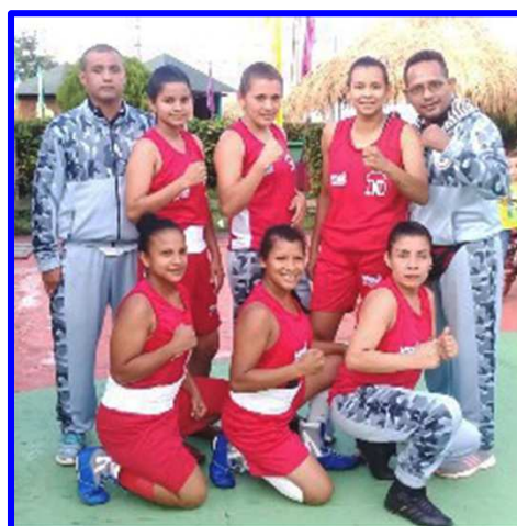
Equipo Femenino “Las Fieras” de Las Minas se apoderaron del campeonato en la VI Edición de la Copa de Boxeo “Alexis Arguello”.

“Tiburones de Granada”, dejó en evidencia su mayor experiencia en el ring y no tuvo dificultad para vencer 4-2 a “Caciques” de Carazo, con