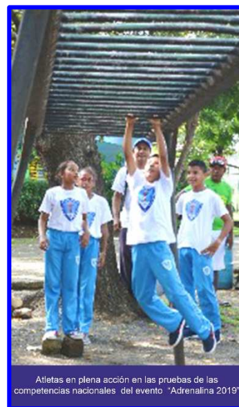
Atletas en plena acción en las pruebas de las competencias nacionales del evento “Adrenalina 2019”.

Por su parte en las competencias de secundaria se coronó campeona del 2019, el centro de estudio “Cristiano Verbo” de la RACCS con tiempo de 10 minutos, desplazando a la segunda posición al colegio “Rubén Darío” de Zelaya central que finalizó cronometran 11.40.30. El tercer puesto fue para la escuela “República de Venezuela” de Managua con 11.57.73.