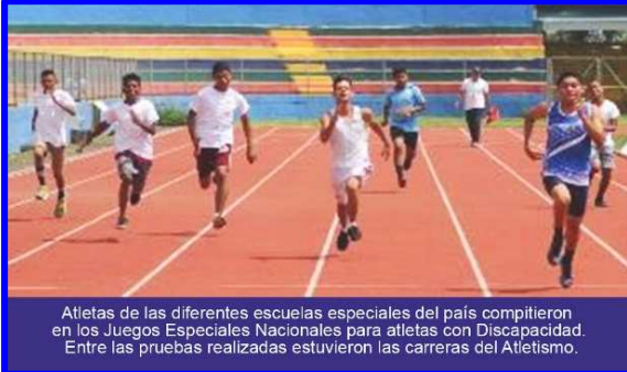
Atletas de las diferentes escuelas especiales del país compitieron en los Juegos Especiales Nacionales para atletas con Discapacidad. Entre las pruebas realizadas estuvieron las carreras del Atletismo.

El día jueves 26 de Septiembre en las instalaciones de la Pista de Atletismo del Estadio Olímpico del IND, la Dirección de Deportes del Instituto Nicaragüense de Deportes, llevó a cabo la realización de los Juegos Estudiantiles Nacionales para atletas con Discapacidad de primaria y secundaria.