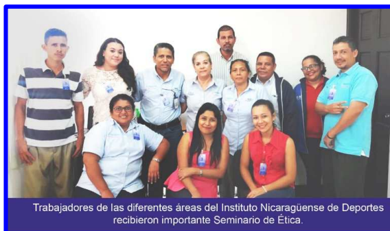
Trabajadores de las diferentes áreas del Instituto Nicaragüense de Deportes recibieron importante Seminario de Ética.