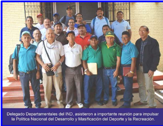
Delegados Departamentales del IND, asistieron a importante reunión para impulsar la Política Nacional del Desarrollo y Masificación del Deporte y la Recreación.

En el marco de la implementación de la Política Nacional del Desarrollo y la Masificación del Deporte y la Recreación líderes deportivos de los consejos zonales, municipales, regionales y departamentales del Movimiento Deportivo “Alexis Arguello”, junto a los Delegados