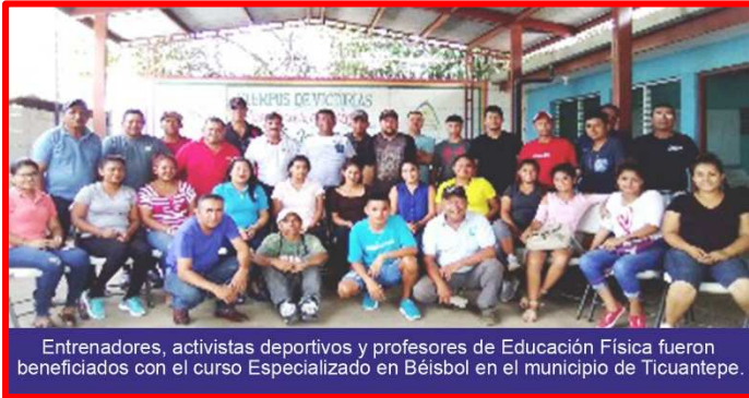
Entrenadores, activistas deportivos y profesores de Educación Física fueron beneficiados con el curso Especializado en Béisbol en el municipio de Ticuantepe.

Luna y en esas mismas fechas pero en Managua se efectuó el curso de Planificación Deportiva y Fútbol Sala, dirigido a profesores de la Universidad del Valle. Además del 17 al 21 en el municipio, de Nindirí departamento de Masaya se llevó a cabo el curso de Organización Deportivas, y Ajedrez, dirigido a Árbitros, entrenadores, activista y